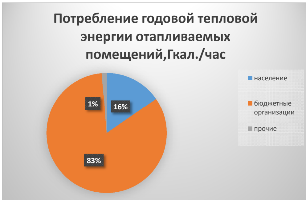
Рис.1. Структура потребления годовой тепловой энергии централизованного теплоснабжения

Объемы потребления тепловой энергии (мощности), теплоносителя и приросты потребления тепловой энергии (мощности), теплоносителя с разделением по видам теплоснабжения в каждом расчетном элементе территориального деления на каждом этапе представлены в таблицах №2-№7.